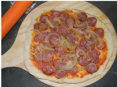
Calabresa - Calabresa defumada e cebola