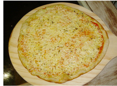
Marguerita - Mussarela, Parmesão e Orégano