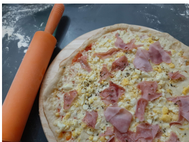
Portuguesa - Mussarela, Ovo cozido e Presunto