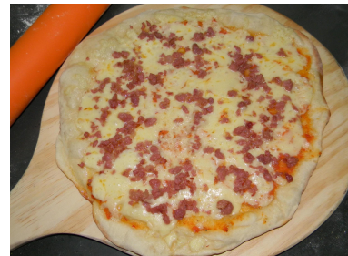
Toscana - Mussarela e Toscana moída frita