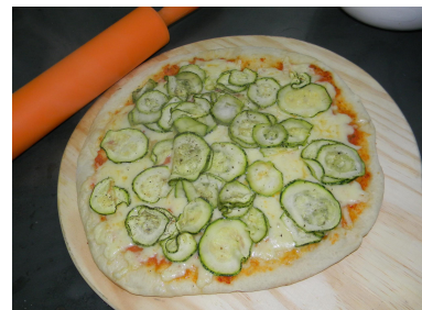
Abobrinha - Mussarela e finas fatias de Abobrinha