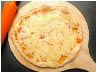
Mussarela - Clássica Mussarela e molho de tomate